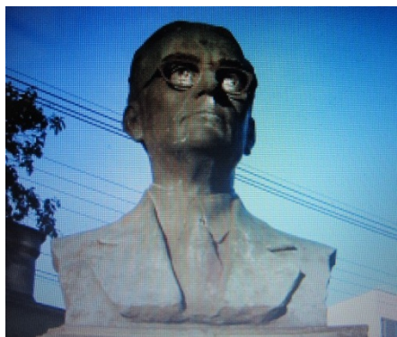
Imagem do busto feita em 2004